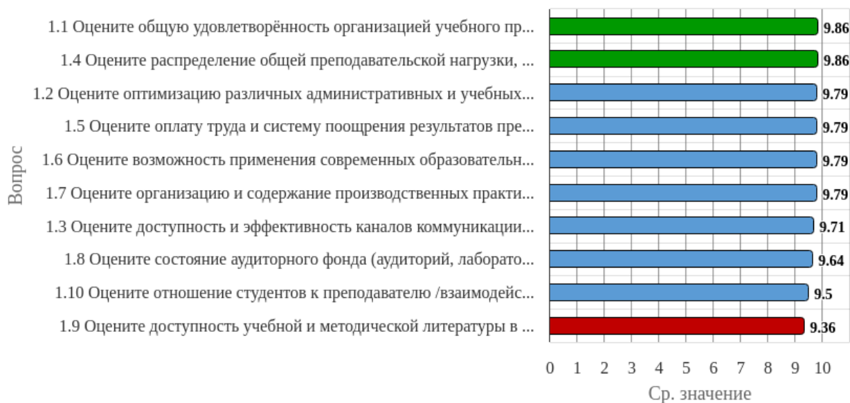
Рисунок 1.1 - Распределение показателей уровня удовлетворённости респондентов по блоку вопросов «Удовлетворённость организацией учебного процесса»

Индекс удовлетворённости по блоку вопросов «Удовлетворённость организацией учебного процесса» равен 9.71.