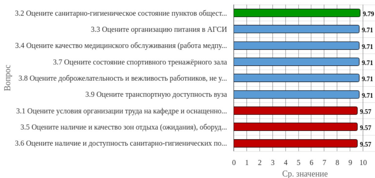
Рисунок 1.3 - Распределение показателей уровня удовлетворённости респондентов по блоку вопросов «Удовлетворённость социально-бытовой инфраструктурой вуза»