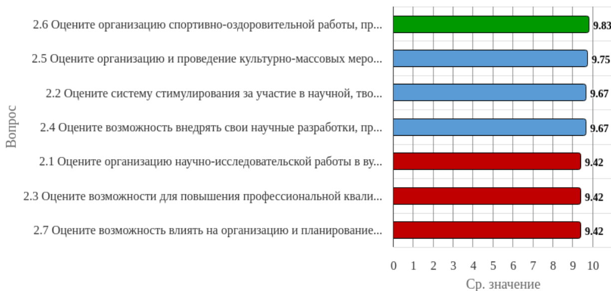
Рисунок 1.2 - Распределение показателей уровня удовлетворённости респондентов по блоку вопросов «Удовлетворённость организацией внеучебной, научной деятельности, возможностью повышения квалификации»

Индекс удовлетворённости по блоку вопросов «Удовлетворённость организацией внеучебной, научной деятельности, возможностью повышения квалификации» равен 9.6.