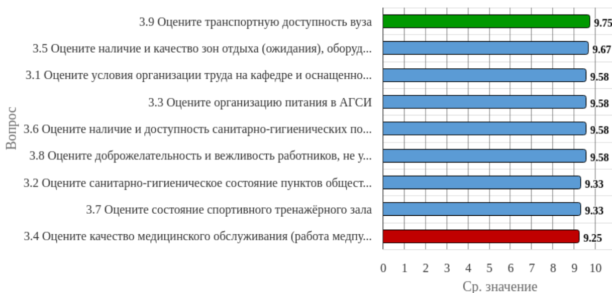
Рисунок 1.3 - Распределение показателей уровня удовлетворённости респондентов по блоку вопросов «Удовлетворённость социально-бытовой инфраструктурой вуза»