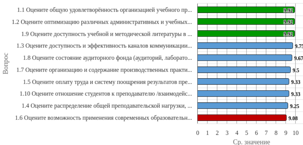
Рисунок 1.1 - Распределение показателей уровня удовлетворённости респондентов по блоку вопросов «Удовлетворённость организацией учебного процесса»

Индекс удовлетворённости по блоку вопросов «Удовлетворённость организацией учебного процесса» равен 9.57.