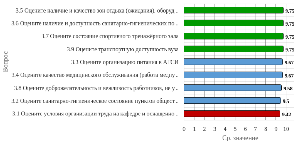
Рисунок 1.3 - Распределение показателей уровня удовлетворённости респондентов по блоку вопросов «Удовлетворённость социально-бытовой инфраструктурой вуза»