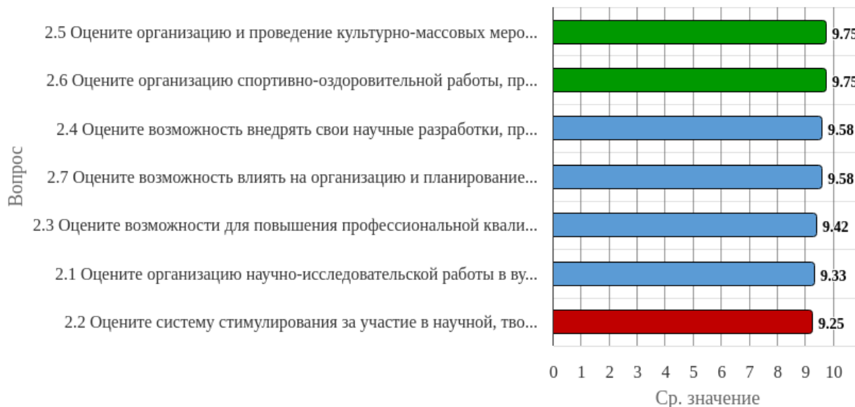
Рисунок 1.2 - Распределение показателей уровня удовлетворённости респондентов по блоку вопросов «Удовлетворённость организацией внеучебной, научной деятельности, возможностью повышения квалификации»

Индекс удовлетворённости по блоку вопросов «Удовлетворённость организацией внеучебной, научной деятельности, возможностью повышения квалификации» равен 9.52.