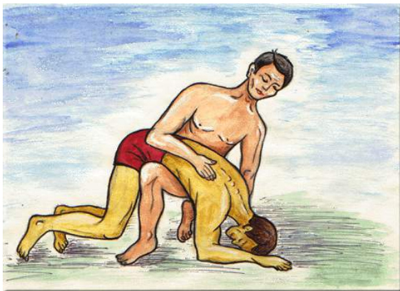
Удаление воды из дыхательных путей утопавшего.